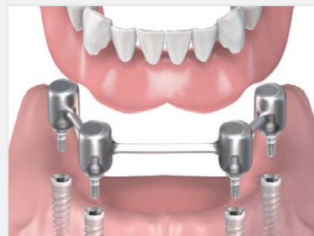
Einsetzen der Vollprothese mit "Stegversorgung"