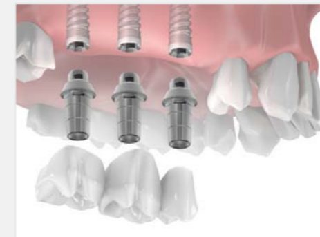
Einsetzen einer "Dreizahnbrücke" auf 2 Implantaten