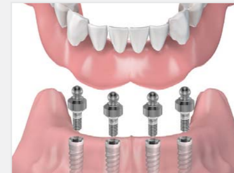
Einsetzen der Vollprothese mit "Druckknöpfen"