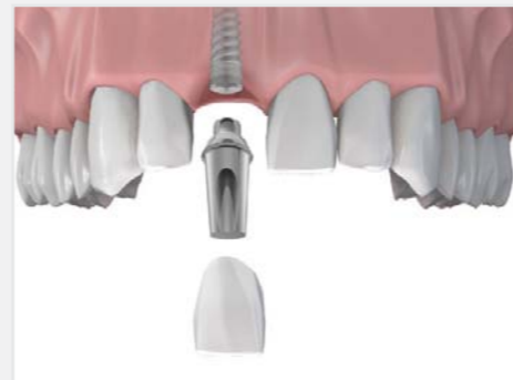
Erneuerung des Einzelzahnes