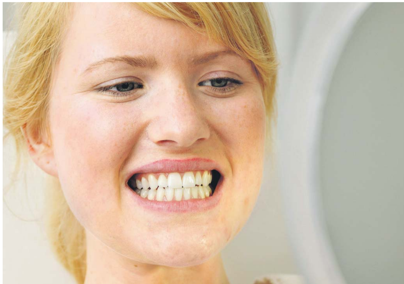
Weiß, weißer, Bleaching: Diese Frau kann zufrieden sein.

Das gilt aber nur für gesunde und eigene Zähne. Künstliche Zähne und auch Kunststofffüllungen lassen sich nicht aufhellen, so dass das Bleichen bei diesen Zähnen zu einem fleckigen Resultat führt. Dies alles gilt es zu bedenken, bevor man den Eingriff plant und viel Geld ausgibt. Die Preise liegen zwischen 300 und 800 Euro. Das günstigste Angebot in Frankfurt fanden wir für 299 Euro inklusive professioneller Zahnreinigung. Diese