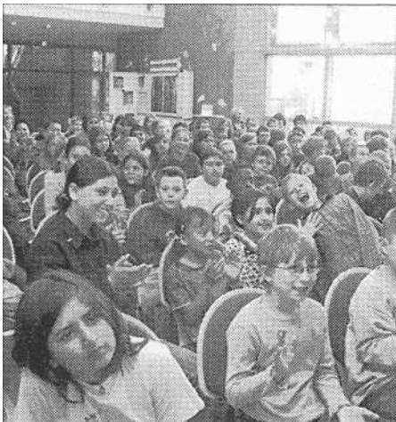
Dritt- und Viertklässler staunten bei der Aufführung..