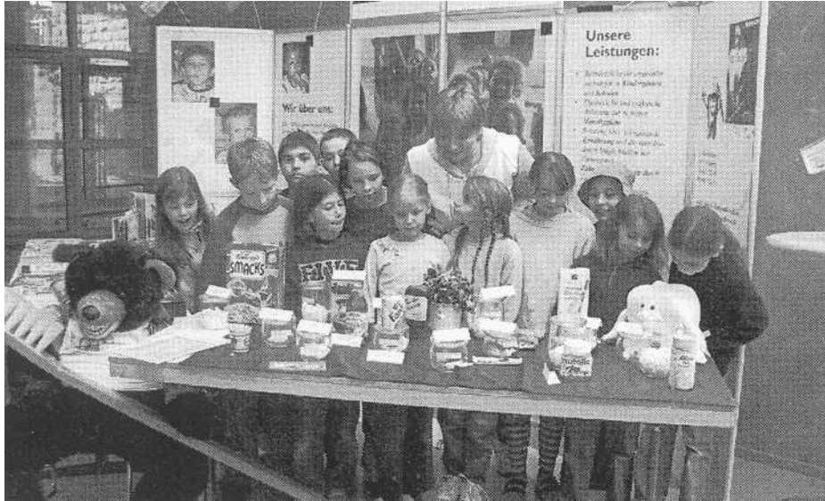
Die Schülerinnen betrachten die Medien- und Zuckerausstellung und sind verblüfft 400g Kaba enthalten 100 Stücke Würfelzucker, 500 g Ketchup gar 50 Stücke und 300 g Gummibärchen versüßen das Leben durch 76 Würfelzucker